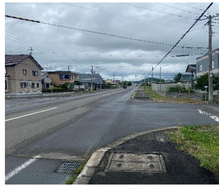
② 旭川方向から見た現場