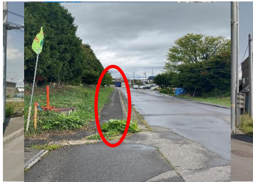
② 旭川方向から見た現場