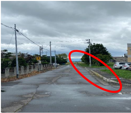
① 当麻市街方向から見た現場