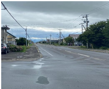
① 当麻市街から見た現場