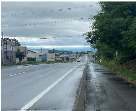
① 当麻山側から見た現場（坂道上側）