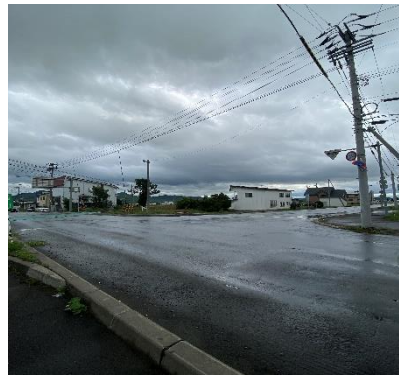
② 当麻市街から見た現場