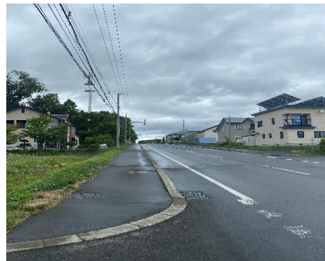
② 当麻市街から見た現場（坂道下側）