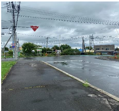
① 旭川方向から見た現場