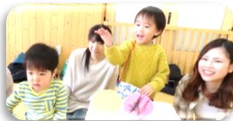
お店屋さんごっこ