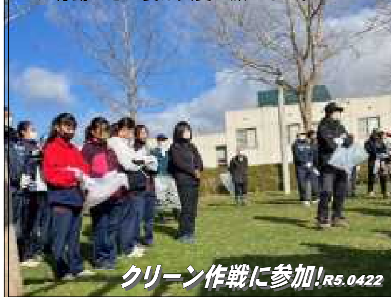
クリーン作戦に参加!R5.0422

4 月22日(土)に、当麻クリーン作戦が3年ぶりに行われ、当麻中学校から女子ソフトテニス部、男子テニスの生徒らが参加しました。この日はスポーツランド周辺に落ちていたゴミや枝を拾い、地域の方々と一緒に施設の整備に汗を流しました。朝早くからの活動でしたが、地域のために行動できた姿は大変立派でした。