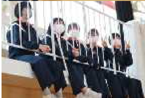
写真(上)三年生の体育の授業の様子。(左)仲間のブレIを応援する様子。(右)後期生徒総会で発表を待つ各常任委員会の委員長たち。