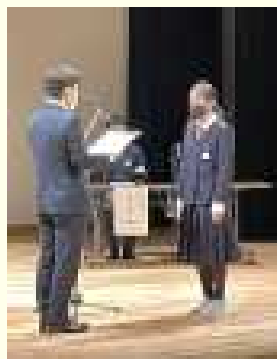
表彰式の様子 ~11月27日(土)