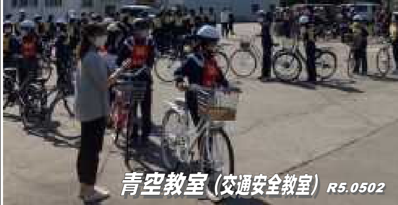
青空教室(交通安全教室) R5.0502

機会に、改めて自転車の正しい乗り方を学ぶことに意義があります。交通安全に対する意識を高め、事故に遭わない、事故を起こさないよう心がけてほしいものです。