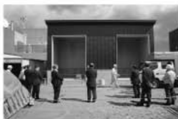
バイオマスボイラー建屋