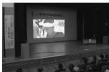
上川管内町村議会議員研修会