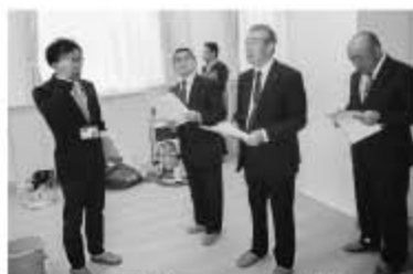
総務文教常任委員会学校視察