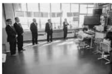
総務文教常任委員会学校視察