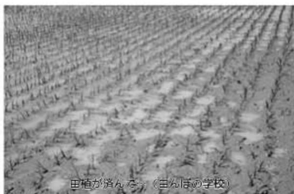
田植が済んで（田んぼの学校）