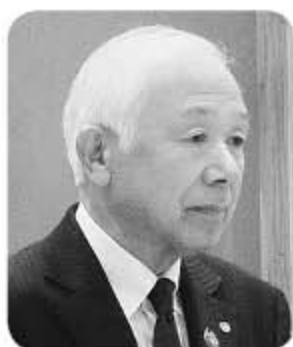
菊 川 町 長

町 長 18歳までの医療費助成については、政府の経済財政諮問会議において、幼児教育や高等教育の無料化に関する方針が示されたことなど、国による子どもへの政策が進められていることから、町としても、国の動向を見極めながら、今後の支援策を考えてまいります。