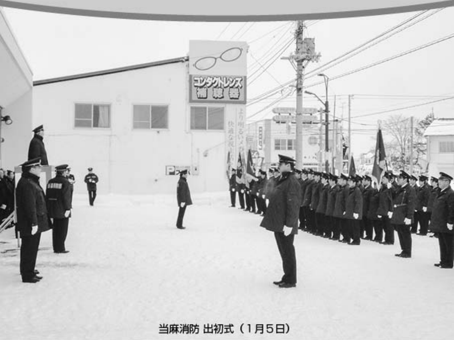
当麻消防 出初式（1月5日）

発行：当麻町議会 北海道上川郡当麻町3条東2丁目11番1号 TEL (0166) 84-2111