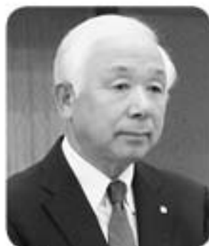
菊 川 町 長