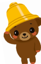
上川町 かみっきー