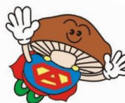
愛別町 あいちゃんマン