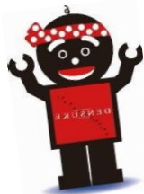
当麻町 でんすけくん