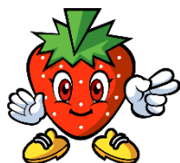
比布町 スノーベリー